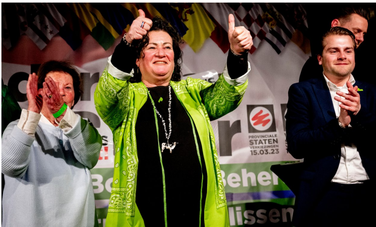
Лидер BVB Кэролайн ван дер Плас во время провинциальных выборов

выступают лишь как средство для мелких собственников высказывать своё мнение в политике, не позволяя оставшемуся большинству активно влиять на ситуацию.