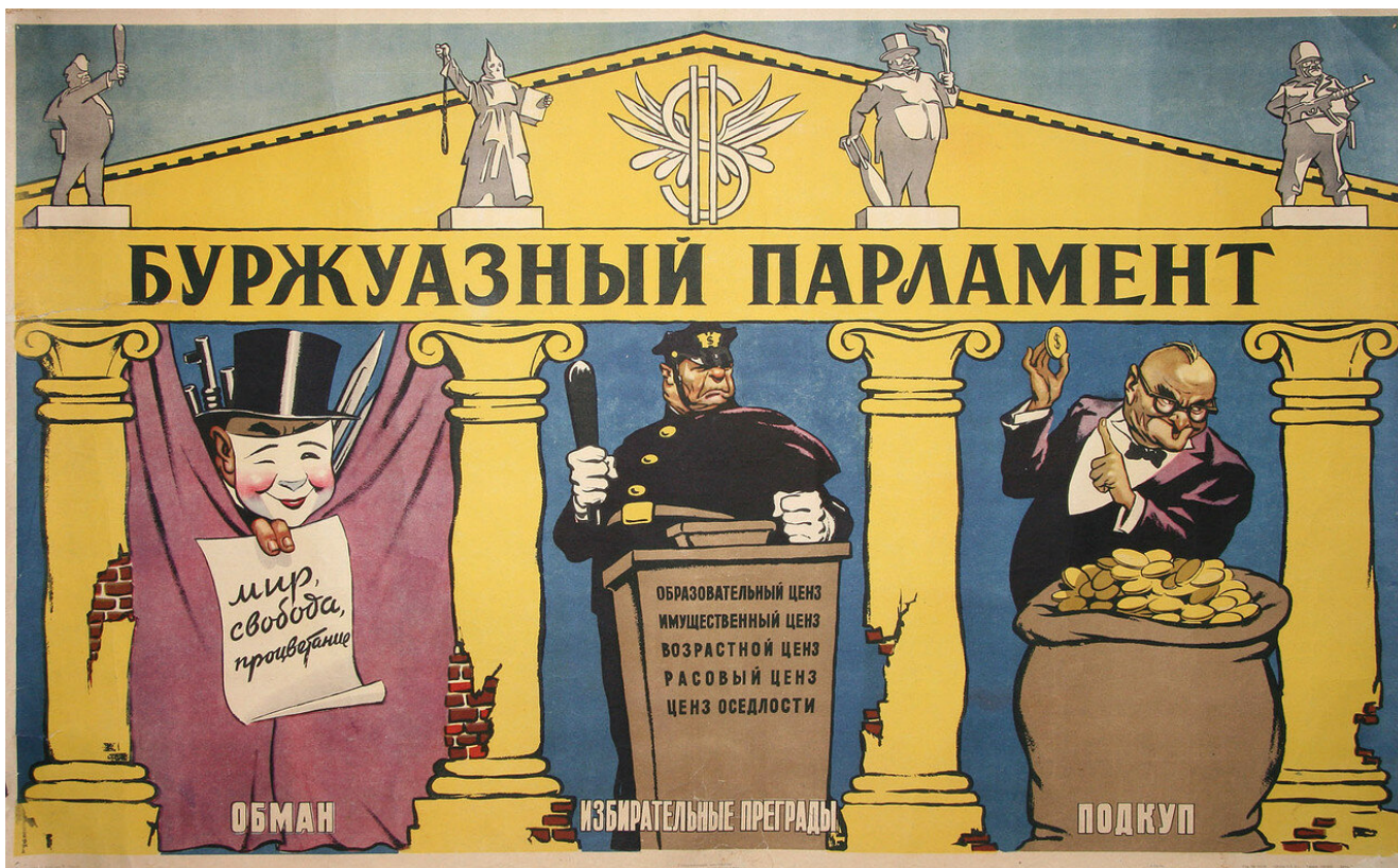
«Буржуазный парламент», советский плакат, художники Брискин В. и Иванов К., 1954 г.

Можно ли изменить этот порядок вещей? Всё вышеперечисленное показывает, что недостатки существующей системы настолько глубоки, что её невозможно исправить реформами. В результате единственной альтернативой может быть только полный отказ рабочего класса от веры в капиталистические обещания. Как писал Ленин: