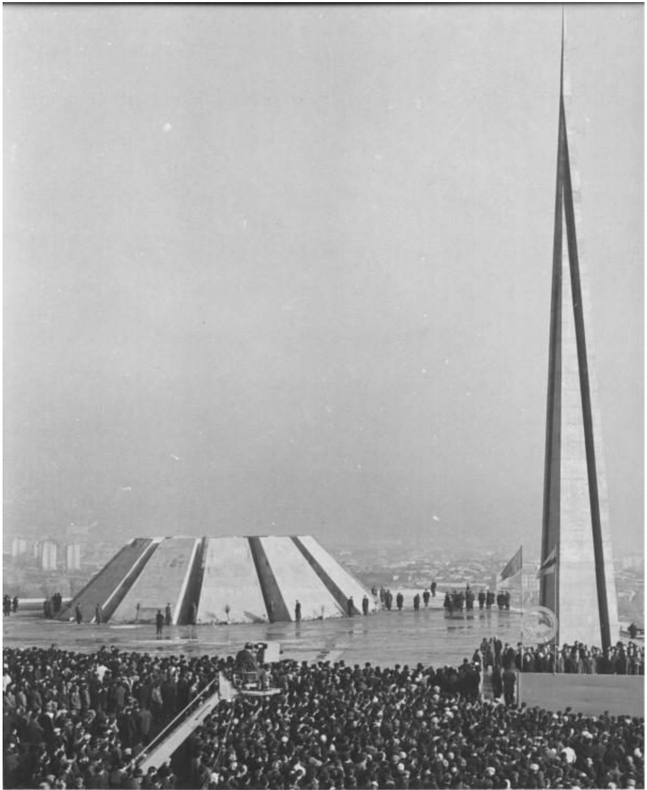
Торжественное открытие мемориального комплекса Цицернакаберд

В том же месяце Госстрой Армении объявил конкурс на проект памятника, в котором могли участвовать, как частные лица, так и организации. Было представлено 78 проектов, из которых только четыре дошли до последнего этапа голосования. Это были два разных проекта с одинаковым названием «Феникс», проект «Муш» и «Флаг Армянской ССР». Однако жюри посчитало, что ни один из этих проектов не раскрывает идеи возрождения Армении — условия, предъявленного конкурсом. Было решено не присуждать первой премии. Второе место занял проект «Флаг Армянской ССР», а третье —