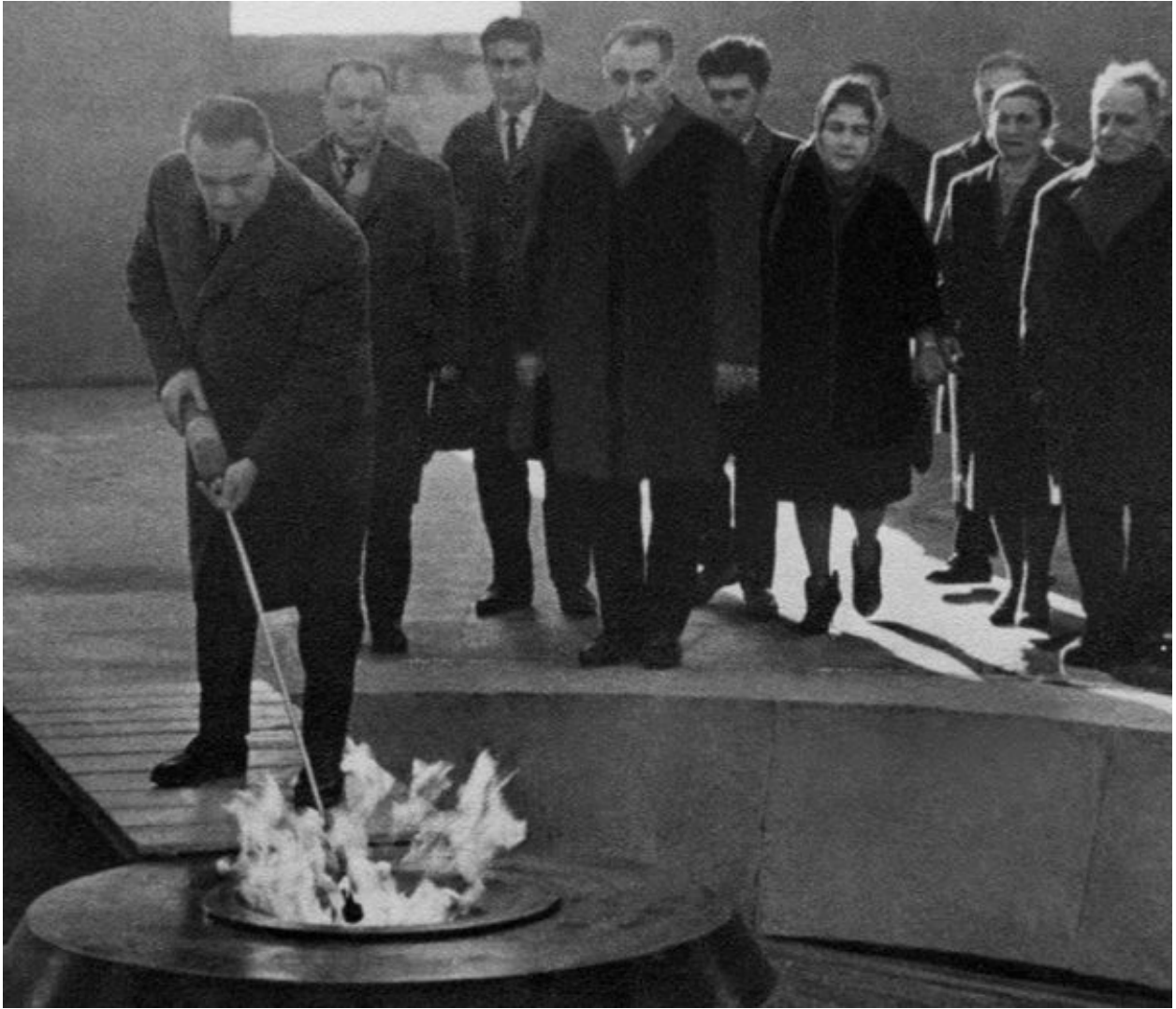
29 ноября 1967 года. Первый секретарь ЦК КП Армении А. Кочинян зажигает вечный огонь мемориала

«Феникс». Примечательно, что проект «Флаг Армянской ССР», занявший второе место в конкурсе, и есть сегодняшний.