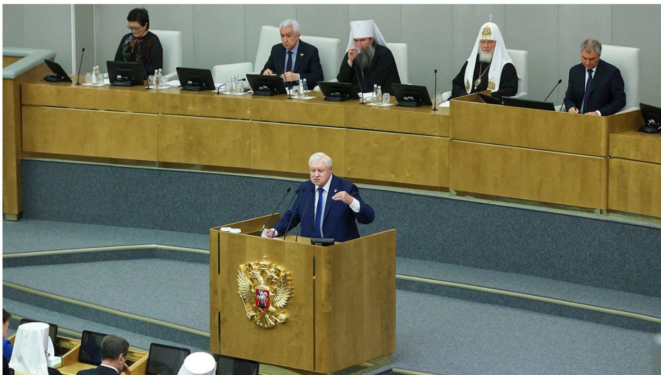
Пленарное заседание Государственной Думы

Но даже и в тех регионах, где благосостояние стало выше, получилось это скорее в отчётах чиновников, чем на деле. Ситуация аналогичная с бедностью — заявляют, что количество бедных уменьшается, а на деле — растёт.