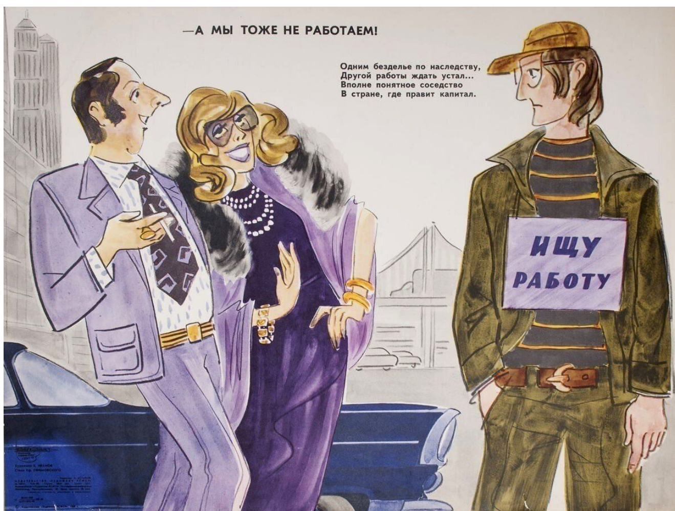
Карикатура на западное общество из журнала «Крокодил». 1970-е гг.

Буржуазное правительство, которое неоднократно заявляло о «стойкости» России к санкциям, проводит в жизнь полумеры, которые не предназначены для того чтобы остановить падение доходов. Не способное на коренные преобразования, оно вынуждено прибегать к символическим социальным выплатам, сколь-нибудь серьёзным образом не меняющим ситуацию, а также демагогии. Но это нисколько не показывает успех в противостоянии с западным санкционным давлением, о чём свидетельствует падение уровня жизни населения, которое стало только хуже после начала СВО и вряд ли когда-нибудь вернётся даже на прежний, довоенный уровень.