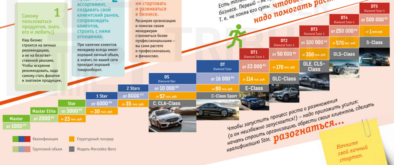
Схема карьерной лестницы менеджера NL обещает «успешный успех»

Есть только два способа не состояться в этом бизнесе. Первый — не прийти в него. Второй — уйти, так и не начав! Т. е. не поняв его суть: чтобы здесь вырасти — надо помогать расти другим.