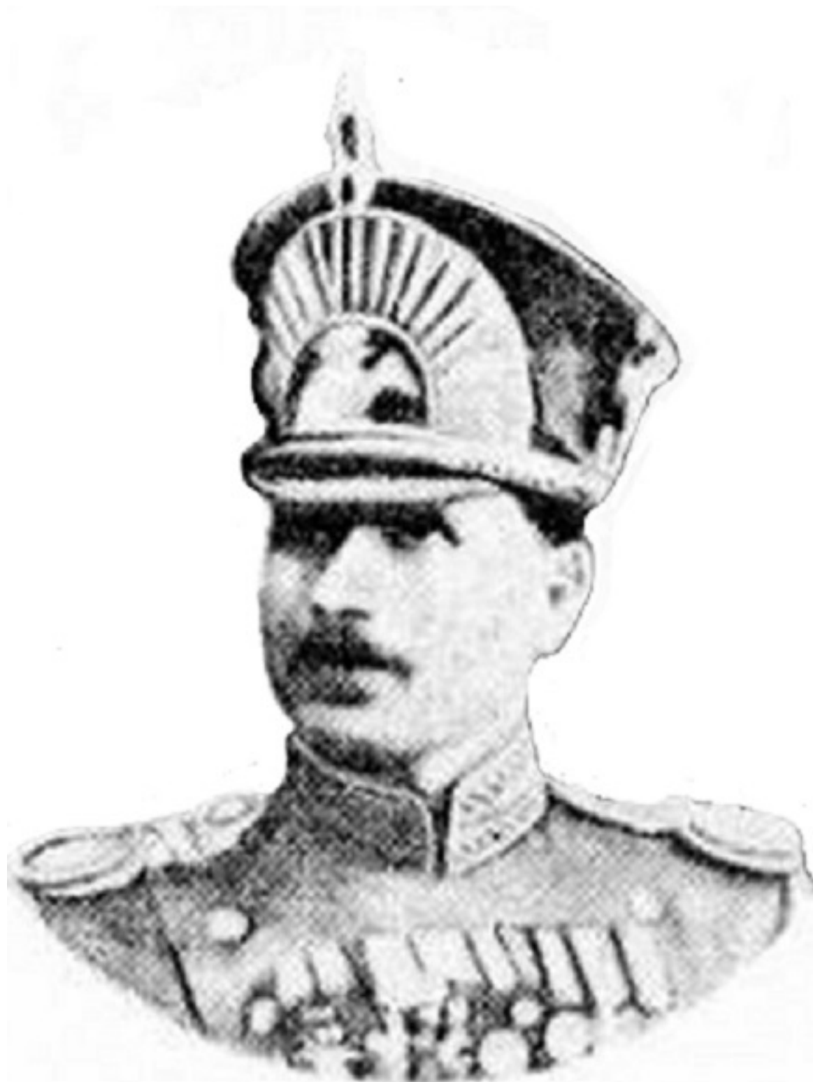
М.А. Муравьев в форме капитана Русской императорской армии, 1916 год

Во время похода Керенского - Краснова на Петроград Муравьев командует войсками Петроградского военного округа, позже - группой войск, сражавшихся на Украине с гайдамаками и румыно-немецкими захватчиками. И уже тогда Муравьев отметился особой жестокостью и самоуправством. После боя под Крутами и взятия Киева председатель ВЧК Феликс Эдмундович Дзержинский писал, предлагая привлечь Муравьева к ответственности: «Худший враг не мог бы нам столько вреда принести, сколько он принес своими кошмарными расправами, расстрелами, предоставлением солдатам