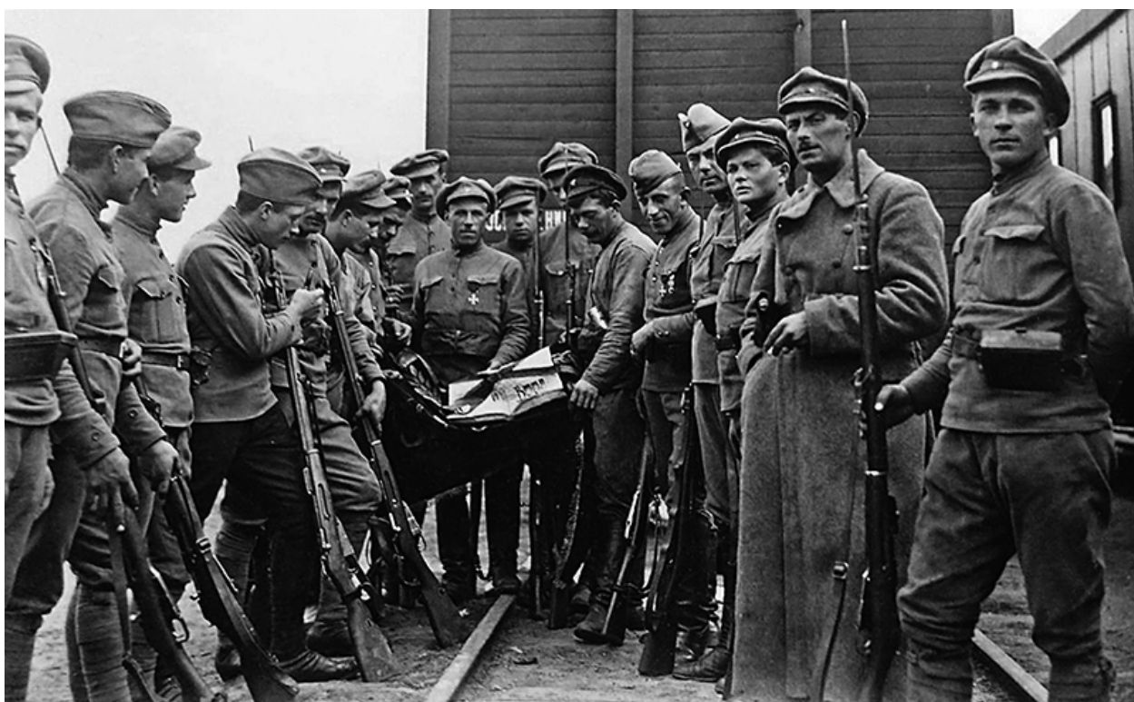
Солдаты Чехословацкого корпуса рассматривают захваченный вымпел красного отряда. Июнь 1918 г.

Не согласные с решением III-его Всероссийского Съезда Советов рабочих и крестьянских депутатов о роспуске учредительного собрания, в связи с отказом им рассмотреть Декларацию прав трудящегося и эксплуатируемого народа, правые эсеры продолжили выступать от его имени и готовить вооруженное восстание уже против советской власти. Так, лидер эсеров В. М. Чернов еще в конце февраля 1918 года обращался к французским и американским послам с целью попросить не только финансовую, но и военную помощь в случае открытого вооруженного восстания. И с апреля, при помощи своих западных коллег, эсеры вступают в контакт с командованием чехословацкого корпуса для планирования общего выступления в Поволжье. Так, мятеж корпуса, начавшийся с середины мая в районе Пензы – Челябинска, дошел до Самары, где после недолгого, но кровопролитного боя и засели учредилловцы.