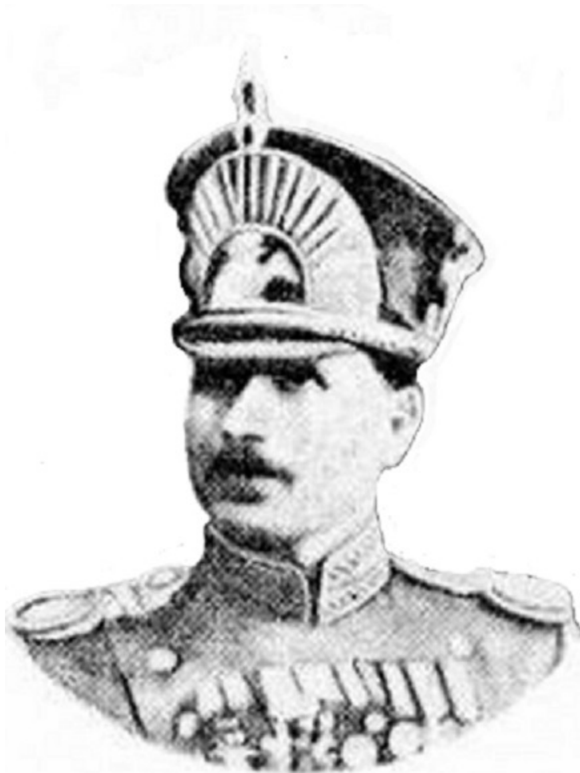
М.А. Муравьев в форме капитана Русской императорской армии, 1916 год

Во время похода Керенского – Краснова на Петроград Муравьев командует войсками Петроградского военного округа, позже – группой войск, сражавшихся на Украине с гайдамаками и румыно-немецкими захватчиками. И уже тогда Муравьев отметился особой жестокостью и самоуправством. После боя под Крутами и взятия Киева председатель ВЧК Феликс Эдмундович Дзержинский писал, предлагая привлечь Муравьева к ответственности: «Худший враг не мог бы нам столько вреда принести, сколько он принес своими кошмарными расправами, расстрелами, предоставлением солдатам