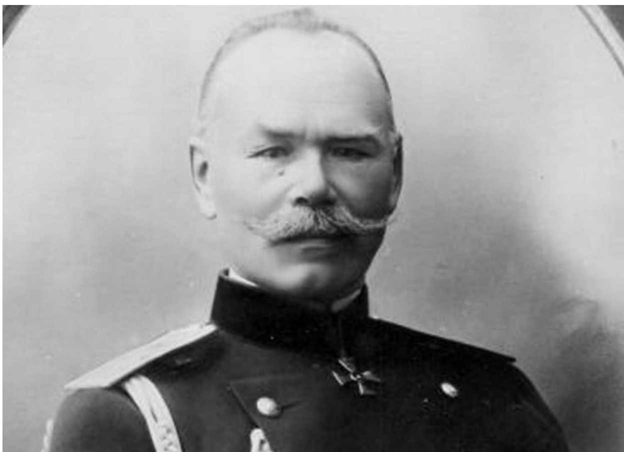
Генерал Алексеев М.В.

Но план командования остался невыполненным не только из-за внутренних проблем, но и по причине изменений замыслов противника. По первоначальному плану интервентов, сообщаемому в начале августа 1918 года главнокомандующему чехословацкими силами французскому генералу Жанену, предусматривалось объединение всех контрреволюционных войск, действующих на севере, Волге и юге, в связанный между собой, единый антисоветский фронт. Основной частью этого плана являлось установление взаимодействия белочехов и комучевцами с Добровольческой армией и с интервентами и белогвардейцами, которые наступали из Архангельска в район Котласа, чтобы затем прорваться к Волге.