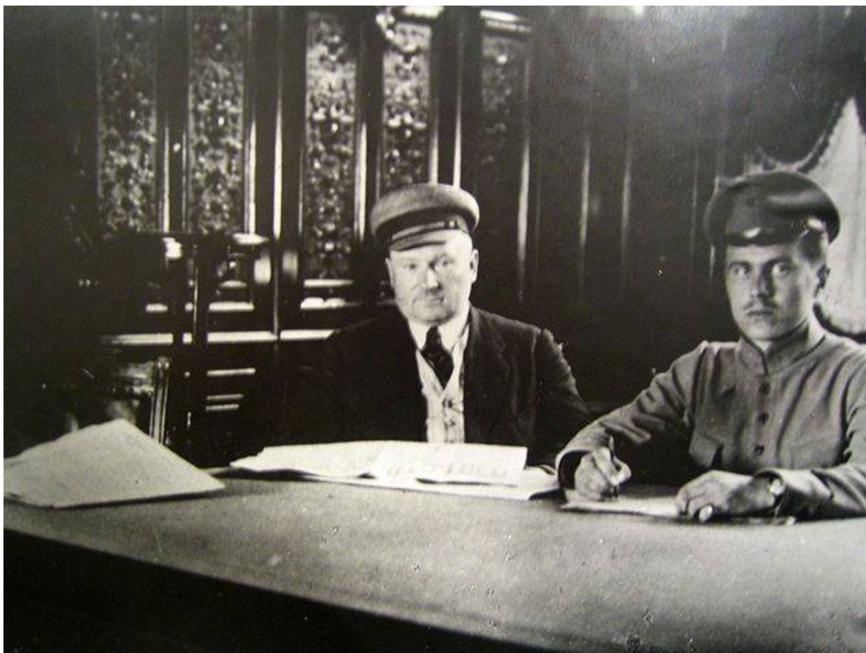
Командующий Восточным фронтом И. Вацетис с адъютантом в 1918 году. штаб фронта

Особо ответственные задачи возлагаются на латышские стрелковые полки, почти все они перебрасываются к Волге в Казань.