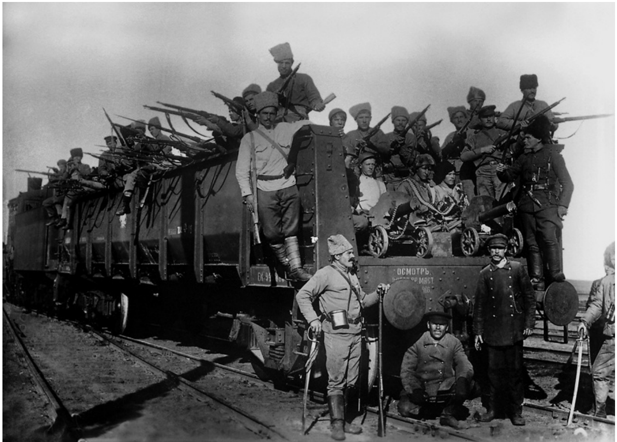
Бронепоезд Красной Армии

Понимая, что главными территориями боевых действий являются многонациональные районы, В. И. Ленин и председатель Центрального мусульманского комиссариата Мулланур Вахитов 15 июня в газете «Правда» и 16 июня в газете «Знамя революции» обратились ко всем трудящимся мусульманам поддержать власть рабочих, крестьян и встать на её защиту. Тогда же выходит предписание всем уездным и местным Советам по мере необходимости организовывать мусульманские комиссариаты «для планомерного удовлетворения нужд рабочих и крестьян мусульман и объединения их вокруг Советской власти».