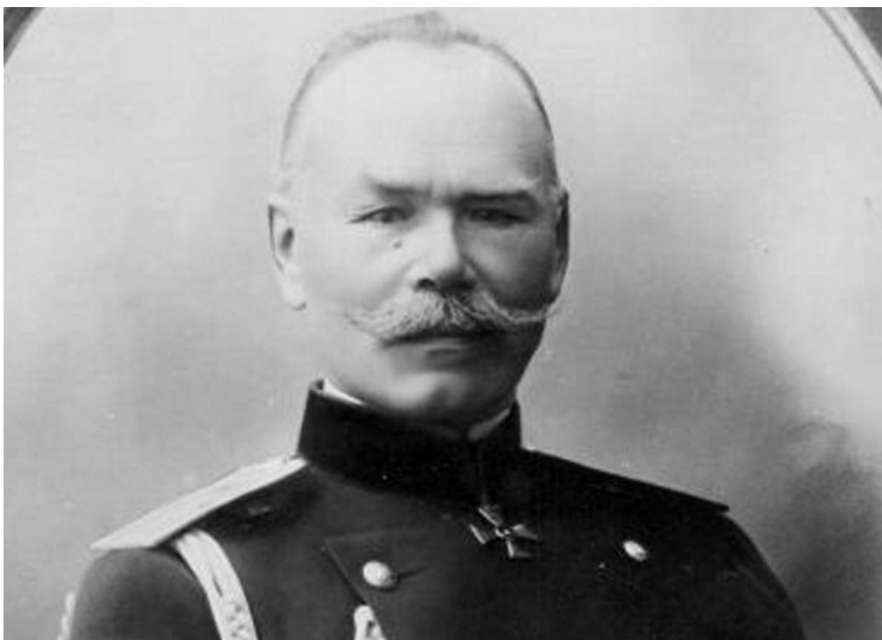
Генерал Алексеев М.В.

Но план командования остался невыполненным не только из-за внутренних проблем, но и по причине изменений замыслов противника. По первоначальному плану интервентов, сообщаемому в начале августа 1918 года главнокомандующему чехословацкими силами французскому генералу Жанену, предусматривалось объединение всех контрреволюционных войск, действующих на севере, Волге и юге, в связанный между собой, единый антисоветский фронт. Основной частью этого плана являлось установление взаимодействия белочехов и комучевцами с Добровольческой армией и с интервентами и белогвардейцами, которые наступали из Архангельска в район Котласа, чтобы затем прорваться к Волге.