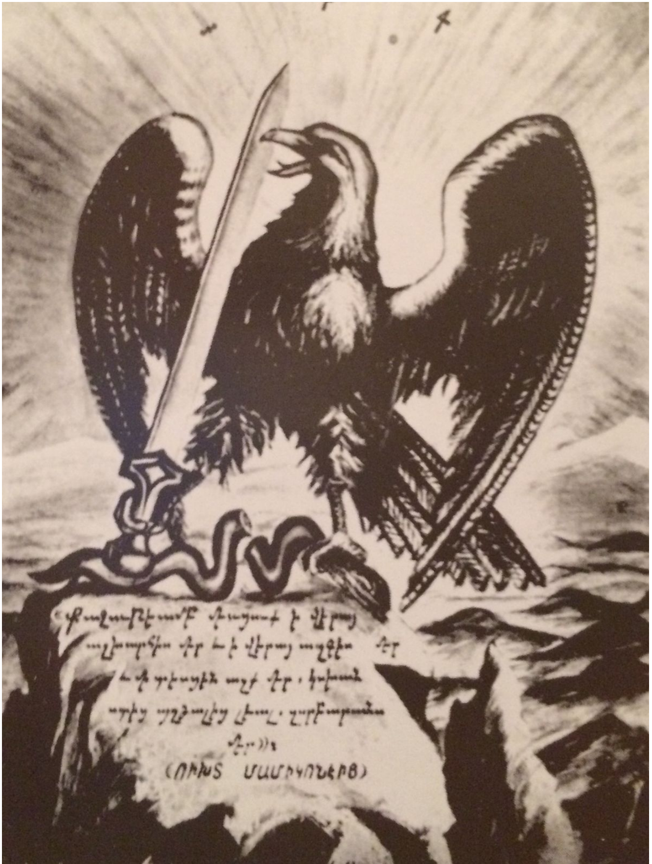
Символ цехакронизма — Таронский орёл

Протокол допроса Нжде (выписка) 2 сентября 1947г., номер 7