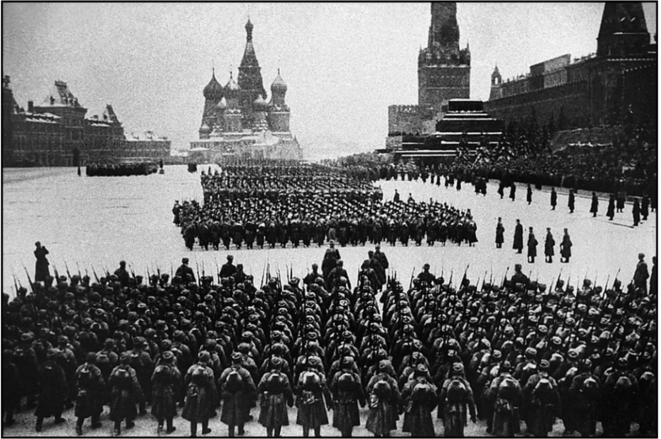
Парад 7 ноября 1941 года

Красноармейцы оказывали героическое сопротивление врагу, не жалея собственной жизни. Их моральный дух не падал даже в самые трудные дни. Особенно сильно его поднял парад в честь Октябрьской революции 7 ноября 1941-го, проведенный несмотря на всю тяжесть ситуации. Большая часть солдат и техники прямо с парада отправились на передовую.